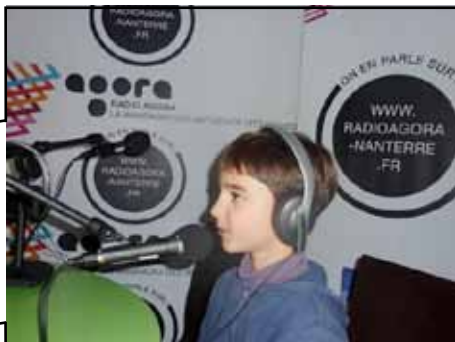
© L'Agora, maison des initiatives citoyennes